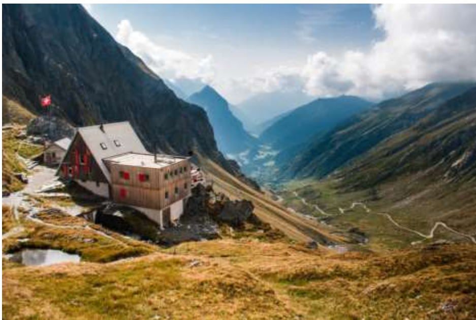
La Capana Scaletta et son panorama