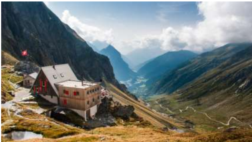
La Capana Scaletta et son panorama