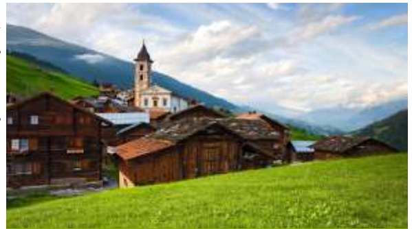
Dans le Val Lumnezia

Prix nuitée : Capanna Scaletta : membre CAS 65.- sinon