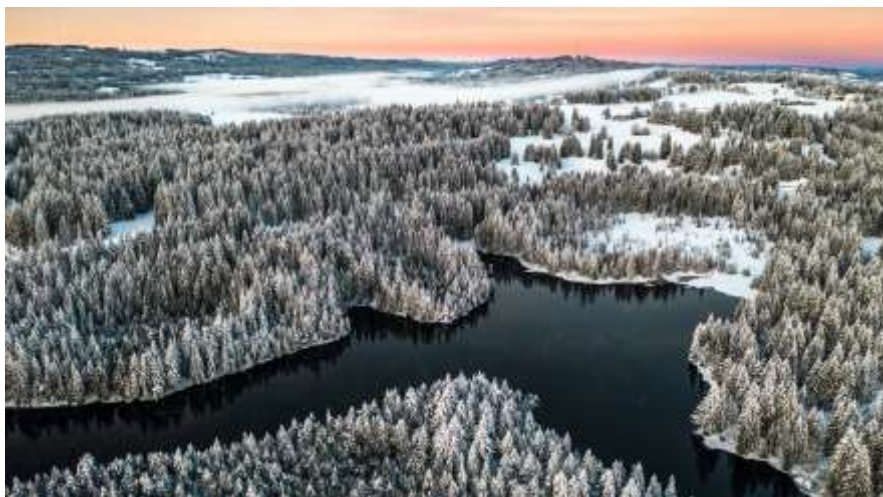
Les Franches-Montagnes en hiver

Il y aura deux parcours à choix, rendez-vous à la gare de Saignelégier à 09h30, nous attendrons le train en provenance de La Chaux-de-Fonds.